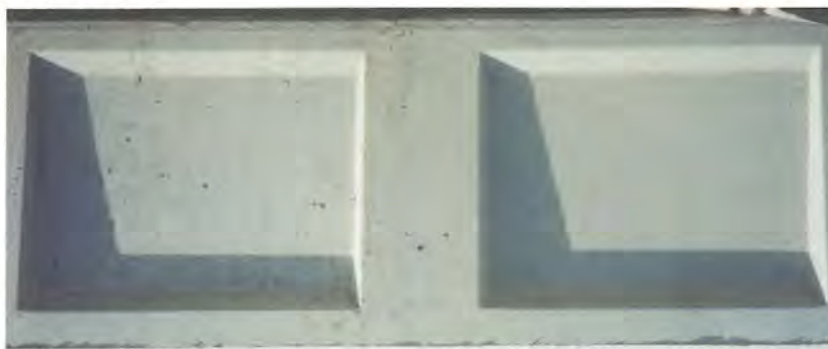
一般的剥離剤使用