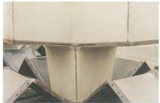
コンクリート配合等、同条件での比較